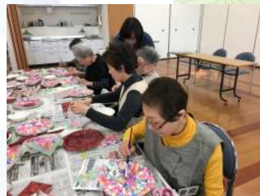
↑皆さん丁寧に作業されています♪