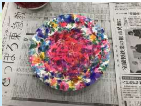
↑こんなに綺麗にできました~(^_^)