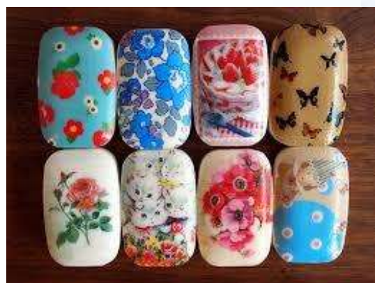
↑デコパーージュの作品例。石鹸やトートバックにデコパーージュしたものです。可愛いですね(^_^)