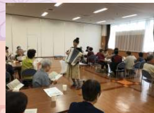
↑14kgもあるアコーディオンを演奏しながら練り歩くよっちゃん。