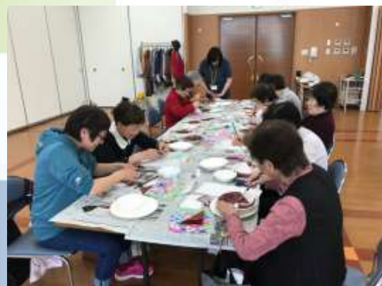
↑おしゃべりしながらの作業が楽しいですね

6月14日のすこやか倶楽部は、デコパーージュ液を使ってお皿を可愛くデコレーションしました♪ 100円ショップで売っている「デコパーージュ液」を使って、お皿にペーパーナプキンを張り付けていきます(お皿もペーパーナプキンも100円ショップで購入したものです)。全く同じ材料ですが、ペーパーナプキンの貼り方で絵柄の出方が違うため、作業する方の個性が出る作品となりました(^_^) 手を動かす作業は、認知症予防にも効果的ですよ。 デコパーージュは石鹸やトートバック、スニーカーにも装飾できるので、お家でも他の物でデコパーージュしてみても楽しいかもしれません。