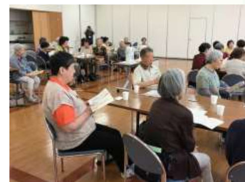
↑皆さん元気に歌います!