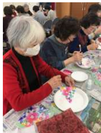
↑何を作っても上手ですね!